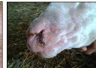
Πρόβατο με αλλοιώσεις ευλογιάς στο πρόσωπο. Κοκκινίλες (κηλίδες), κόκκινα σπυριά (βλατίδες) και μύξες (ρινικό έκκριμα).

Φωτογραφία: αλλοιώσεις Ελισσαίητας, Διοτίσης, Δίνας-Δέσπρας Δέσπρας