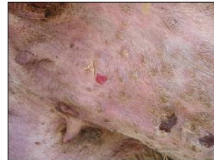
Προχωρημένες αλλοιώσεις ευλογιάς (εφελκίδες) και πληγές (έλκη) στο ίδιο ζώο. Μαύρα κάπαλα