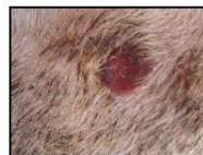
Προχωρημένες αλλοιώσεις ευλογιάς. Πληγές (έλκη).