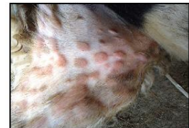
Τυπικές αλλοιώσεις ευλογιάς. Κόκκινα σπυριά (βλατίδες).