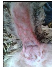
Χαρακτηριστικές αλλοιώσεις ευλογιάς στη βάση της ουράς. Κόκκινα σπυριά (βλατίδες).