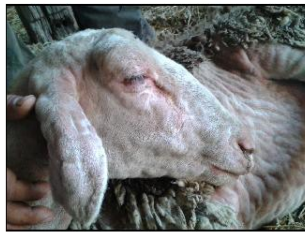
Πρόβατο με εκτεταμένες αλλοιώσεις ευλογιάς στο κεφάλι, το πρόσωπο και την κοιλιά. Κόκκινα σπυριά (βλατίδες).

2 Ψάχνουμε προσεκτικά για : Κοκκινίλες, Κόκκινα Σπυριά, Μαύρα κάπαλα, Πληγές, Μύξες, Δάκρυα