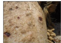
Προχωρημένες αλλοιώσεις ευλογιάς. Μαύρα κάπαλα (εφελκίδες).