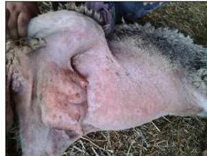
Εκτεταμένες αλλοιώσεις ευλογιάς σε όλη την κοιλιά, στους μαστούς, τους μηρούς, τα γεννητικά όργανα και τη βάση της ουράς. Κοκκινίλες (κηλίδες) και κόκκινα σπυριά (βλατίδες).